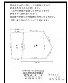
注意点等記載書面

調査士でなければ気付きにくい点や、注意事項がある場合、それらを記載した書面をお渡しします。