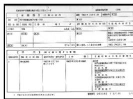
登記事項証明書（要約書）取得

いわゆる登記簿謄本です。図面は不要で登記簿のみが必要な場合でも対応させて頂きます。