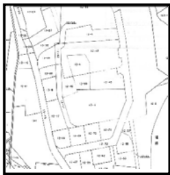
法務局備付地図（公図）取得